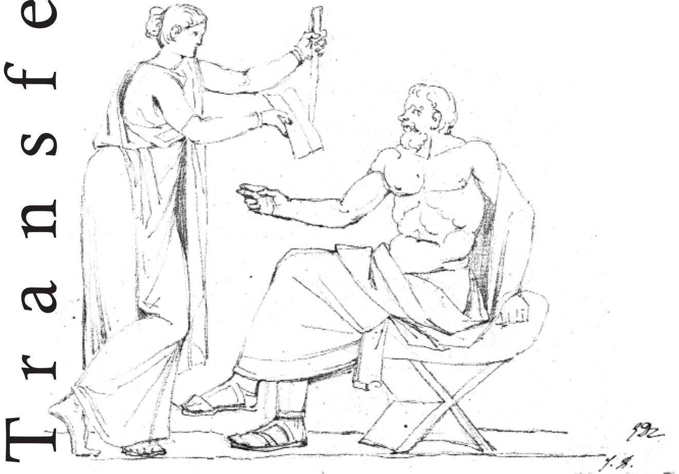
Socrate et Diotime de Jacques-Louis David